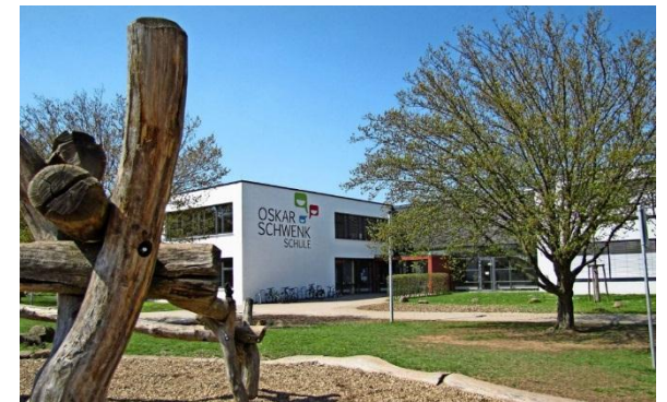
Alle Angebote auf einen Blick...