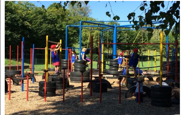
Ferienbetreuung im Ganztag